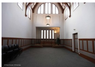
Prétoire de la Maison Cantonale