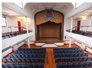
Salle de conférence

(*) L'APAD (Association des Professionnels.elles de l'Animation et Développement) est une association d'éducation populaire et un espace de formation qui visent à développer les échanges de pratiques et les relations avec les publics de l'animation et de l'action sociale ! Son ambition est de puiser vers une nouvelle énergie positive autour de la jeunesse et de permettre in fine d'ajuster et/ou de renouveler des propositions concrètes à l'aune notamment des clivages générationnels en cours dans la société française !.