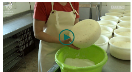
Vidéo filière produit « Lait : un bien-être de qualité »

Certains contenus seront également disponibles sur : www.artisansdumonde.org/ressources/e/